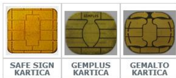
Slika br. 1

Potrebno je uporediti čip na vašoj kartici sa čipovima koji su prikazani na slici br.1